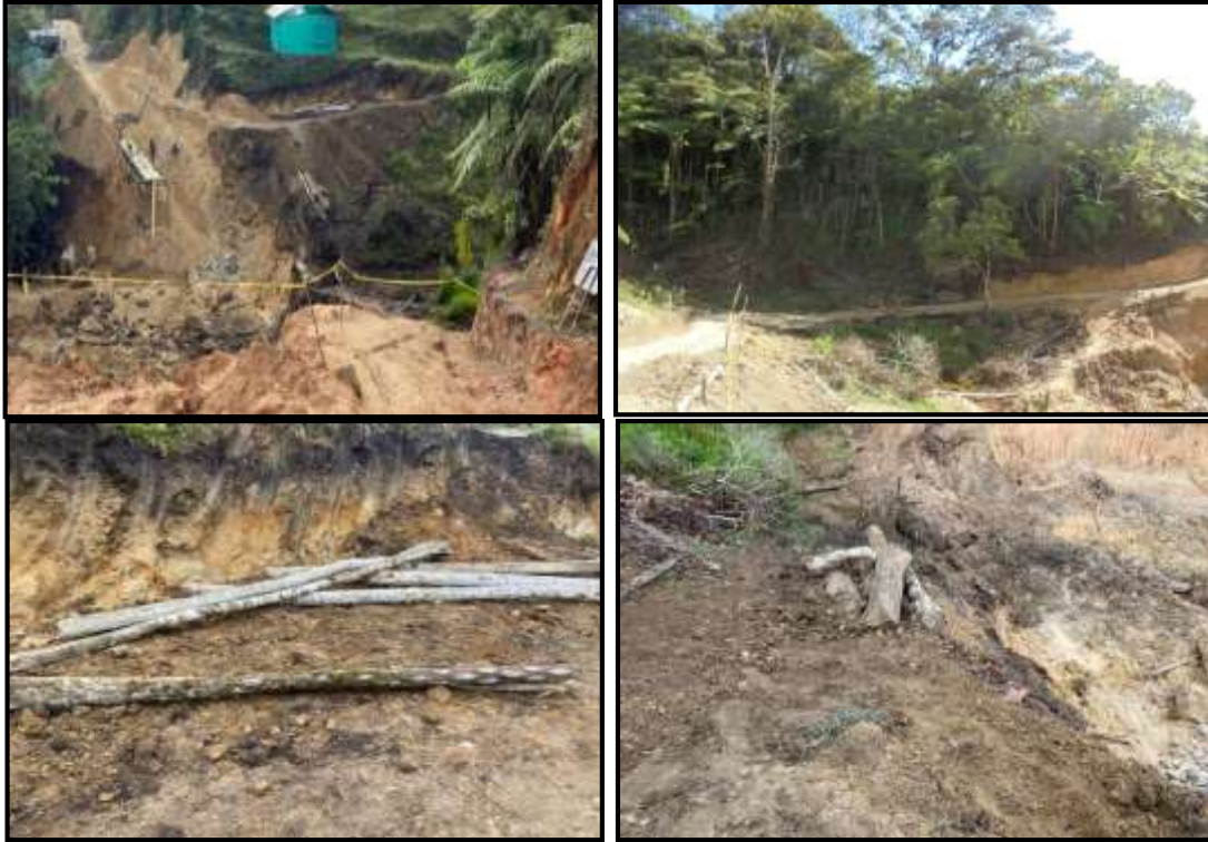
Imágenes 3, 4, 5 y 6: Evidencias de la Zona intervenida, construcción del puente vehicular.