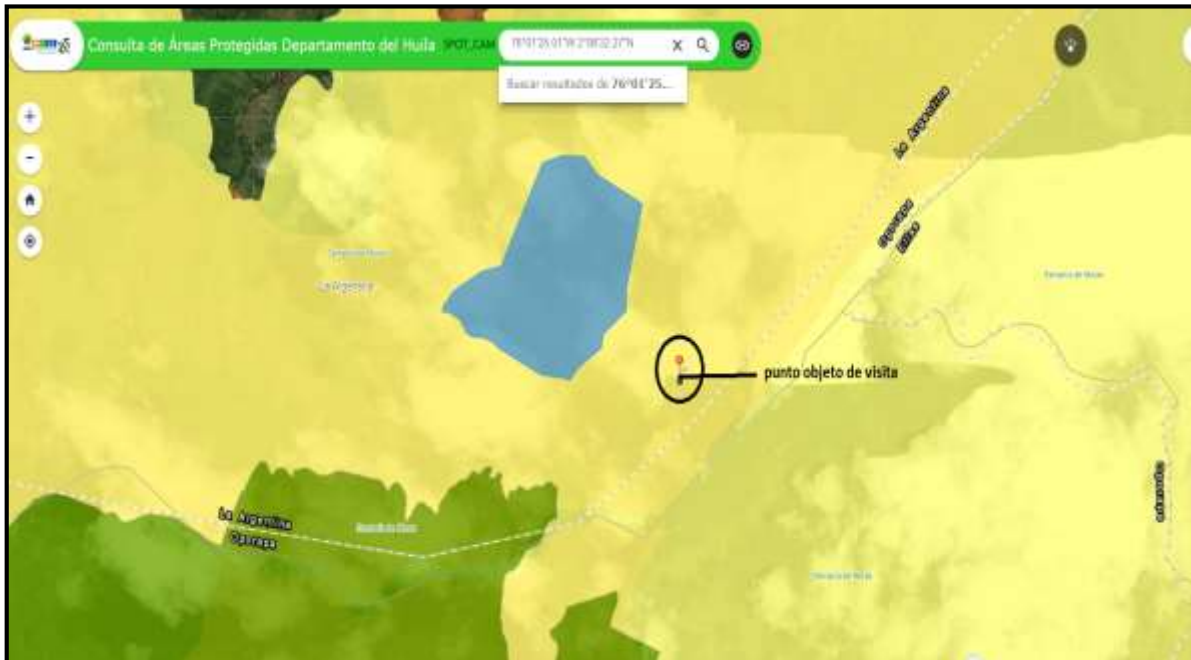
Imagen 2. Localización del punto objeto de la visita. Construcción del puente y DRMI Serranía de Minas.