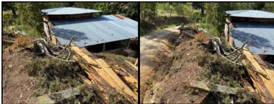
Figura 4 y 5: Evidencias de la zona de ubicación de los árboles.