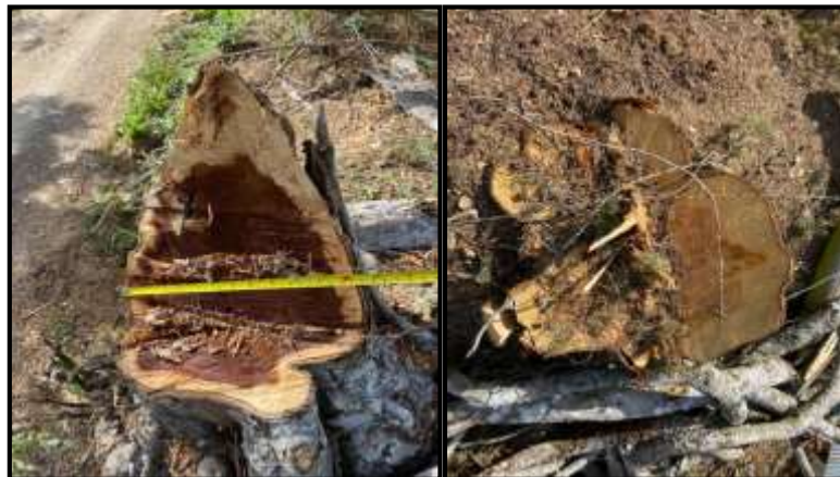
Figura 2 y 3: Tocones de los individuos forestales intervenidos.