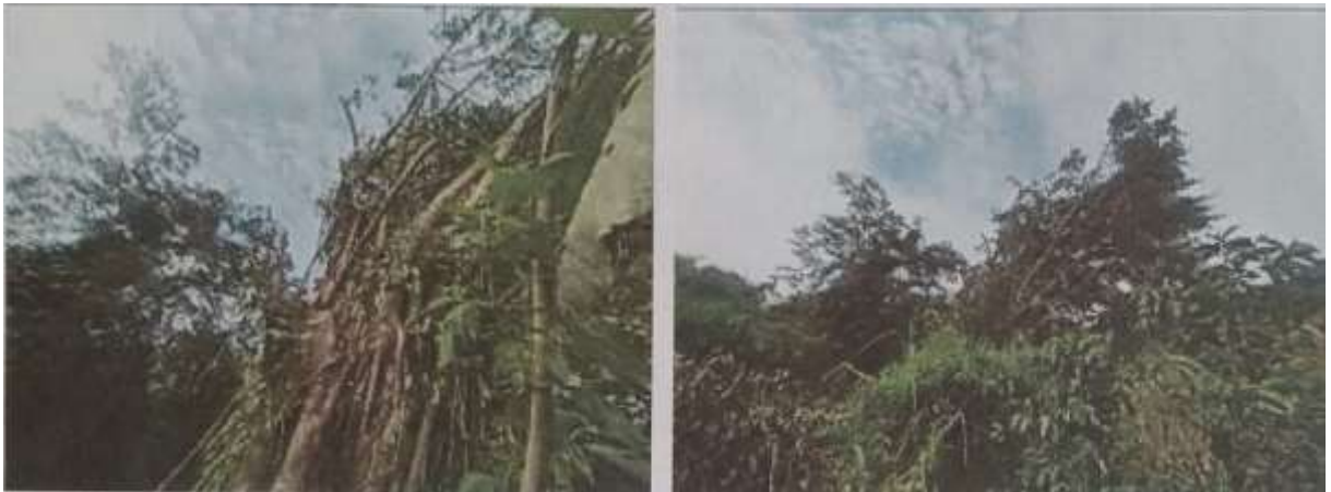
Fotografía 3 a 6. Recorrido por la parte media del límite del predio con la vía, se evidencia el corte anti técnico de las ramas de un individuo de la especie de nombre común Caucho.