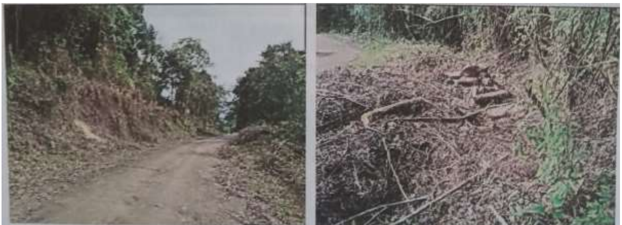
Fotografía 11 a 14. Panorámicas del lugar objeto de la visita, donde se logra evidenciar material apilado tocones de los arboles aprovechados sobre la margen de la vía.