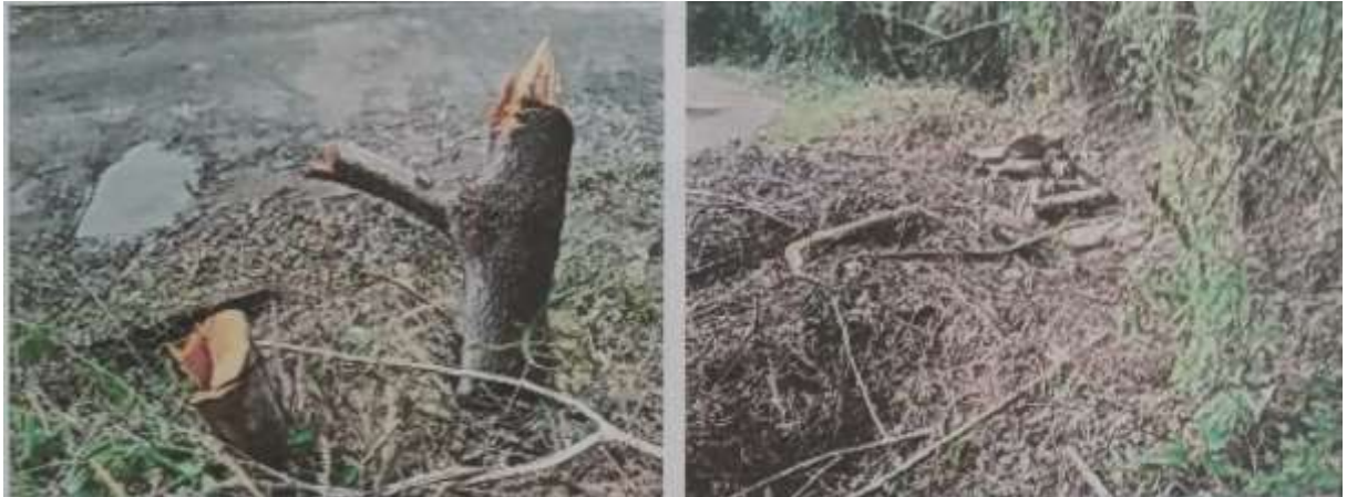
Fotografía 7 a 10. Tocones de árboles cortados sobre la parte final del tramo limite predio del señor Ancizar Embus Muñoz y la vía carretable.