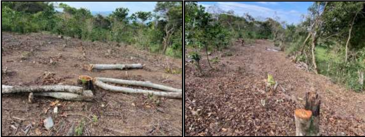
Imagen 6 y 7: Evidencias de la zona de ubicación de los árboles.