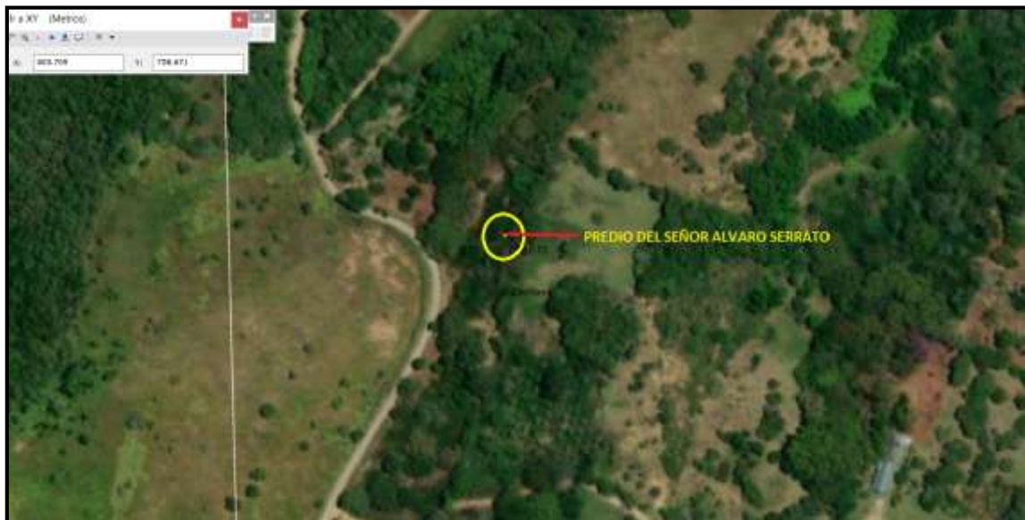
Imagen 1. Localización del punto objeto de la visita. Predio del señor Álvaro Serrato.

El lugar objeto de la visita no se encuentra inmerso dentro de ninguna figura de conservación al verificar en el SIG de la CAM mediante vistas aéreas, adicionalmente no se evidencio afloramiento ni fuente hídrica cerca al área.