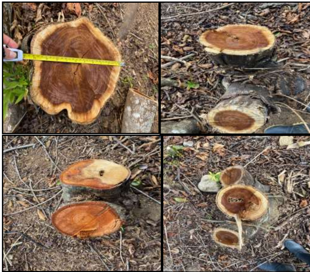
Imagen 2,3,4 y 5: Tocones de los árboles intervenidos.