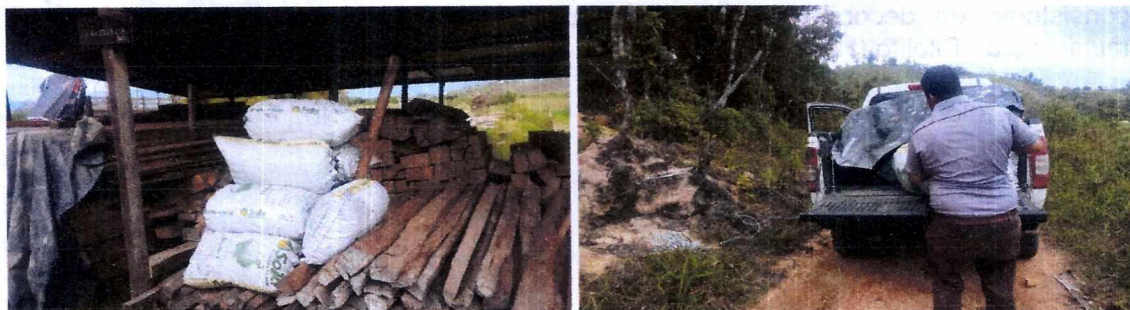
Fotografías 1,2 muestran el carbón decomisado y transportado a las instalaciones de la CAM