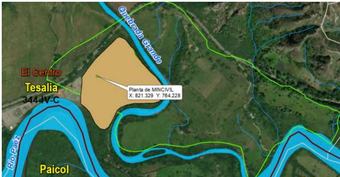
Nota: Tomado del ArcMap 10,5.