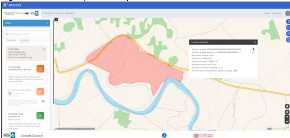
Nota: Tomado del Geoportal Instituto Geográfico Agustín Codazzi (IGAC 2023).