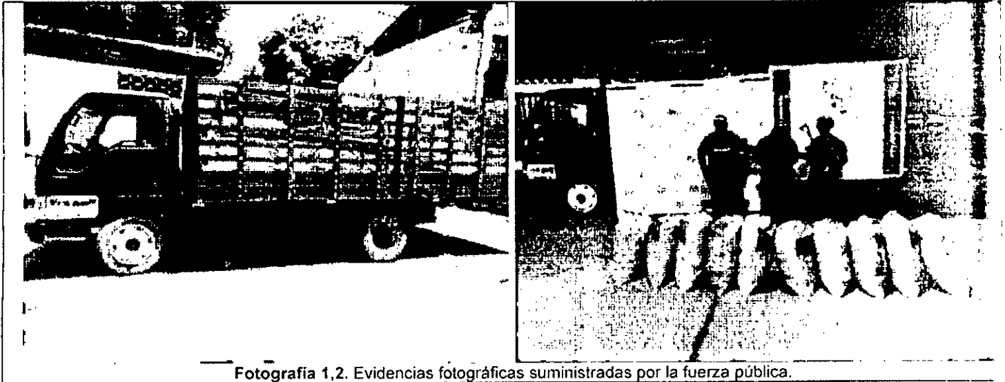
Fotografía 1,2. Evidencias fotográficas suministradas por la fuerza pública.

El decomiso preventivo, se considera procedente porque al no presentar el respectivo Salvoconducto Único Nacional que ampare legalidad, se constituye en incumplimiento a lo dispuesto en la Resolución No. 0753 del 09 de mayo de 2018 "Por la cual se establecen lineamientos generales para la obtención y movilización de carbón vegetal con fines comerciales, y se dictan otras disposiciones" específicamente en el artículo 6. Requisitos para la movilización de carbón vegetal y que cita: Todo aquel que esté interesado en transportar carbón vegetal con fines comerciales, deberá contar con el respectivo Salvoconducto Único Nacional expedido por la Autoridad Ambiental competente.