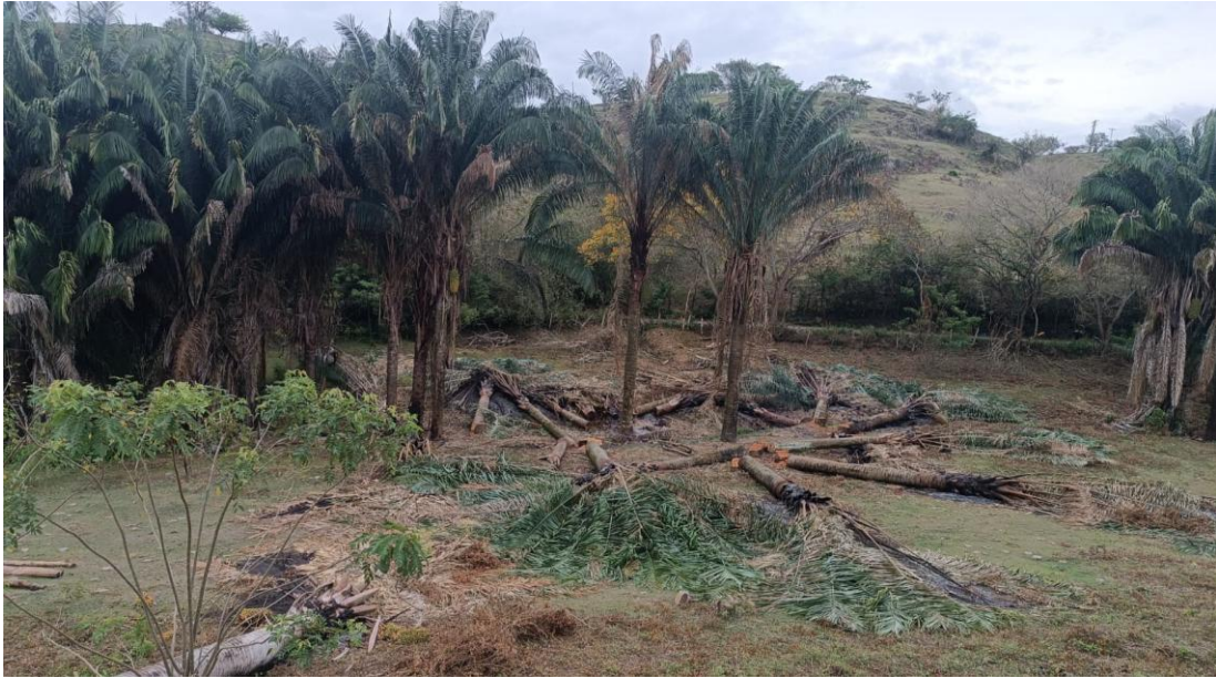
Fotografía No. 2, 3, 4, 5, 6 y 7: Detalles de los individuos forestales talados, vereda La Galda, jurisdicción del municipio del Agrado.