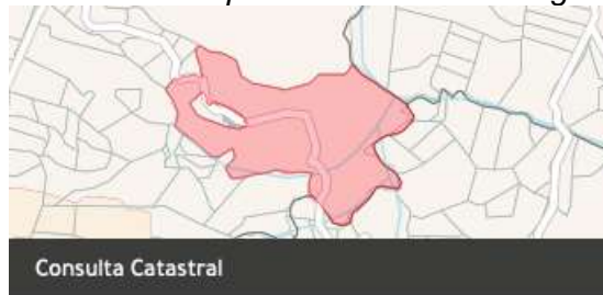
Figura 1. Ubicación del predio en el Geoportal del Instituto Geográfico Agustín Codazzi.

Número predial: 413960001000000170020000000000 Número predial (anterior): 41396000100170020000 Municipio: La Plata, Huila Dirección: PALESTRO Área del terreno: 636004.1 m 2 Área de construcción: 679 m 2 Destino económico: Agrícola Número de construcciones: 4