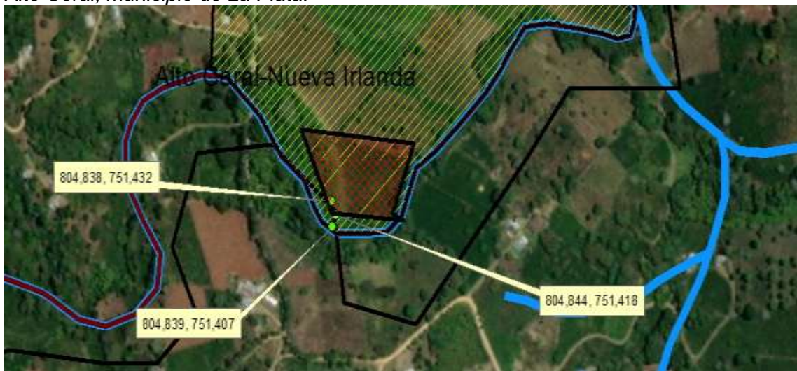
Figura 4. Polígono del área afectada dentro del predio PALESTRO, vereda Nueva Irlanda – Alto Coral, municipio de La Plata.

Nota: Localización del punto objeto de la visita. Predio PALESTRO (GPS GARMIN map 62s).