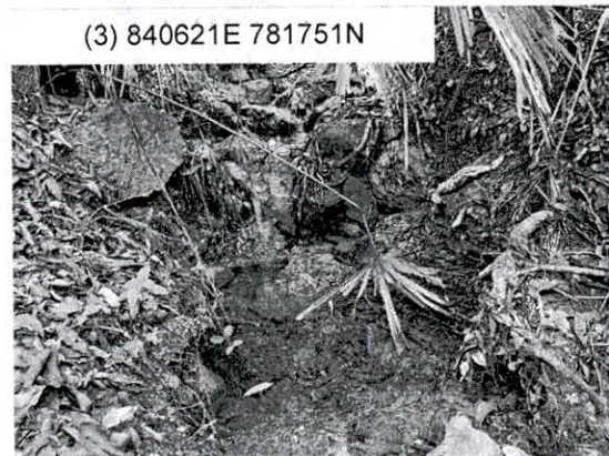
Foto 1-2-3. Puntos de Captación