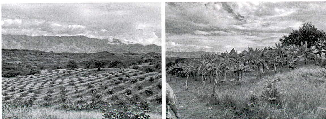
Foto 4 y 5. Cultivos de Limón y Cultivos de Pancoger.