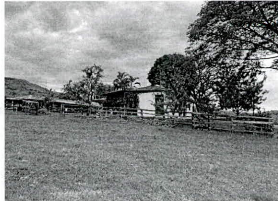
Foto 6 y 7. Tanque de Almacenamiento y Casa predial.