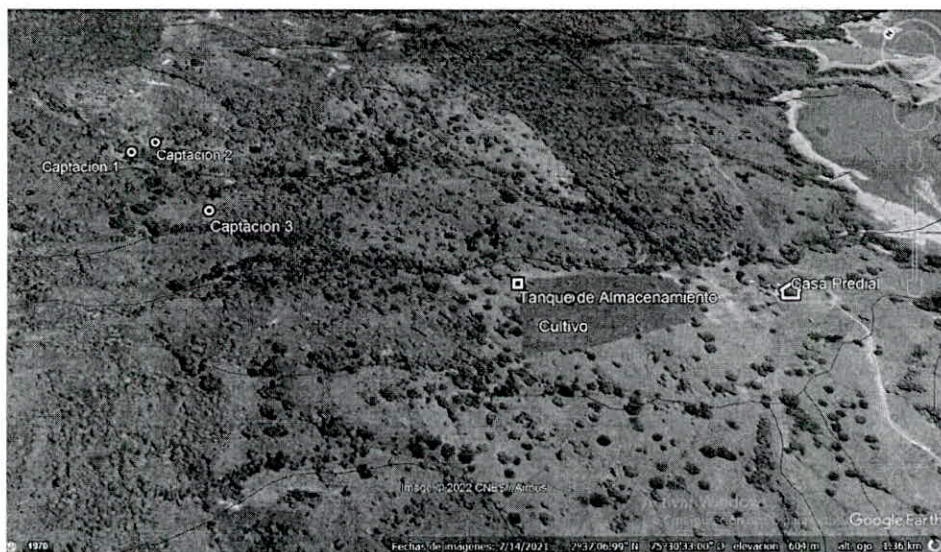
Imagen 1. Ubicación geográfica del predio