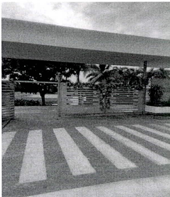
Fotografía 1: Predio Lote Condominio Club Campestre Neiva.

Uso para ejercer la actividad agropecuaria; riego de zonas verdes (12 has), (según radicado No. 20223100156402 del 05 de junio del 2022).