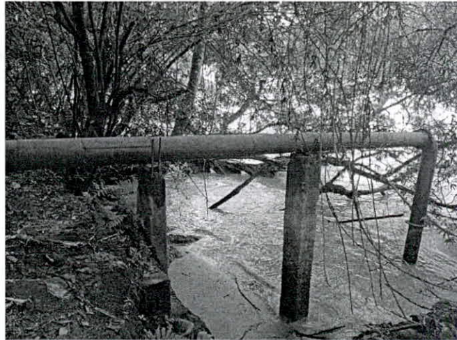
Fotografía 1: Punto de captación sobre el Río Magdalena.