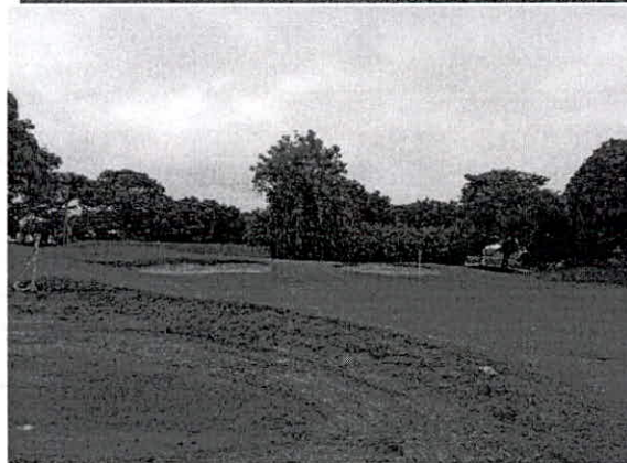
Fotografía 4 y 5: Riego para zonas verdes (campo de golf).