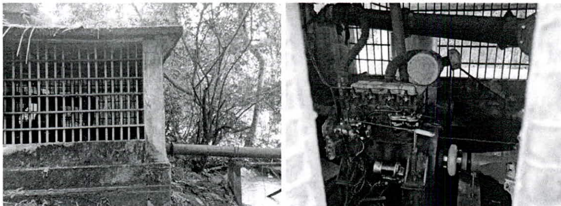
Fotografía 2 y 3: Planta de bombeo para riego de zonas verdes.