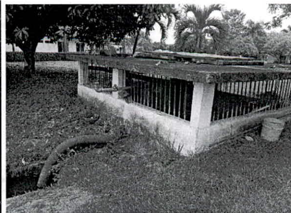
Fotografía 6 y 7: Reservorio y planta bombeo.