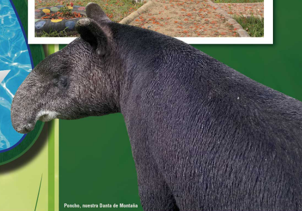
Poncho, nuestra Danta de Montaña

Finca Marengo (Km 4 vía Pitalito-San Agustín) Dirección Territorial Sur de la Corporación Autónoma Regional del Alto Magdalena -CAM-