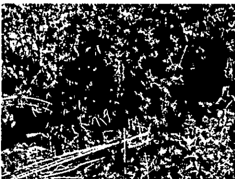
Fotografía No. 1. Zona de rocería.