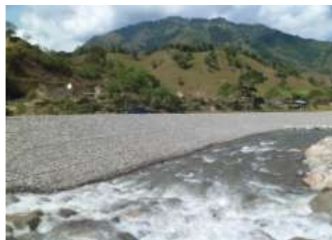
Registro fotográfico del avance de las obras – sitios crítico del rio bache municipio de Santa María