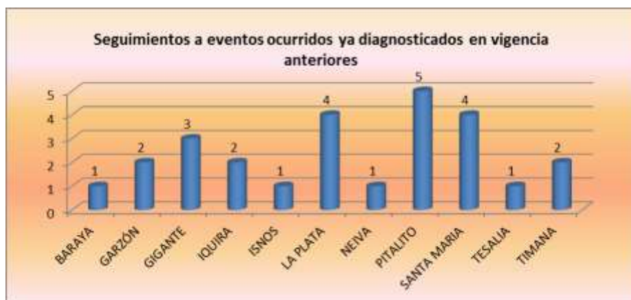
Figura 16. Seguimientos a eventos ocurridos ya diagnosticados en vigencia anteriores.

Adicionalmente, se realizaron 26 de visitas a requerimientos de asesoría en 11 municipios, a sitios donde ya habían ocurridos eventos o amenazas naturales y se hacía necesario su monitoreo para evaluar su condición de riesgo.