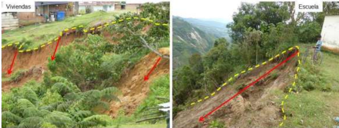
Fotografías que muestran el FRM que afecta algunas viviendas y la escuela del Centro Poblado Salto de Bordones (municipio de Isnos). Fotografías tomadas en diciembre de 2014.