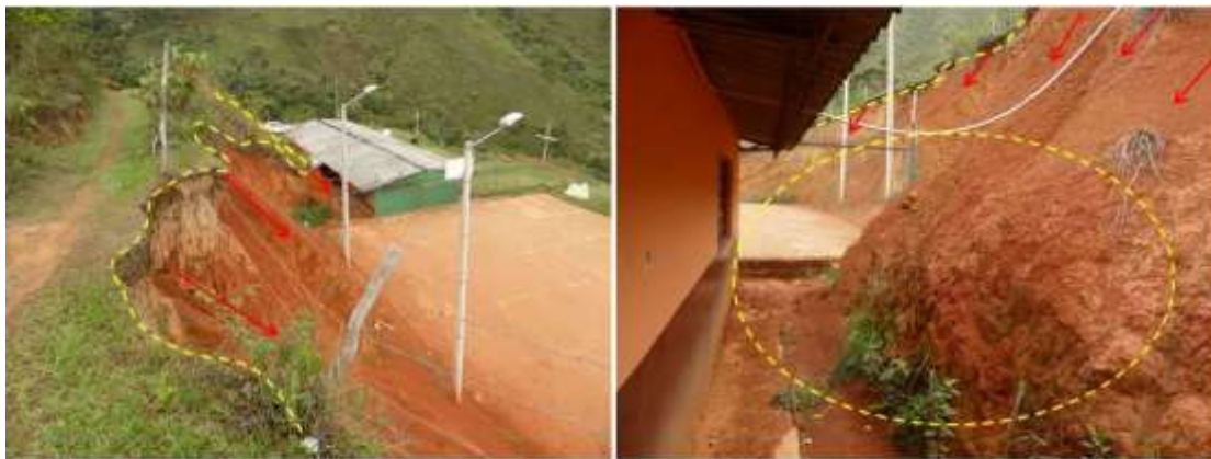
Fotografía que muestra la escuela de El Vergel, del Municipio de Paicol, amenazada por un fenómeno de Remoción en Masa.