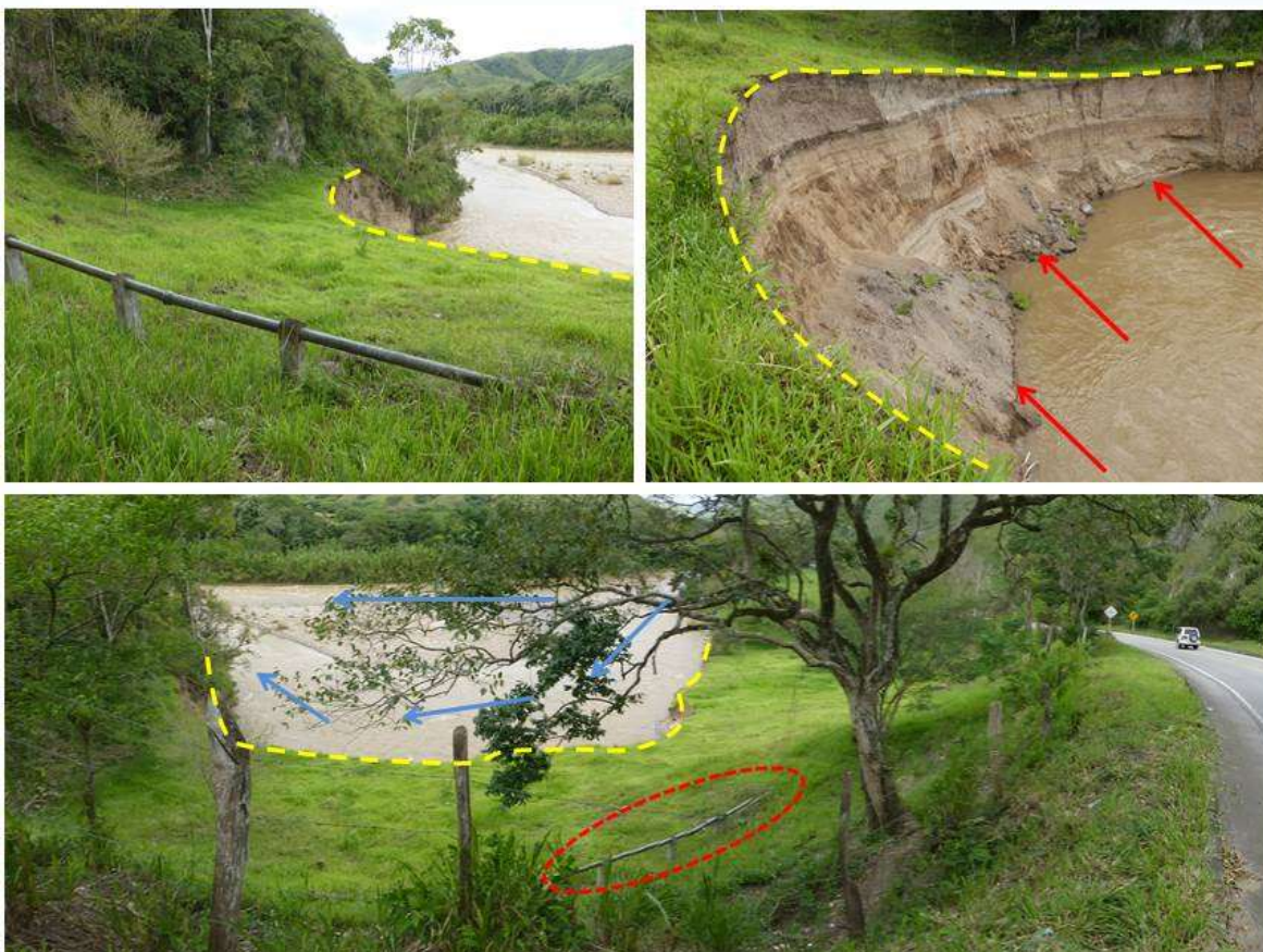
Fotografías que muestran al río Suaza que amenaza con destruir un tramo del acueducto municipal de Altamira y la vía que de ese municipio comunica a Suaza y Florencia.