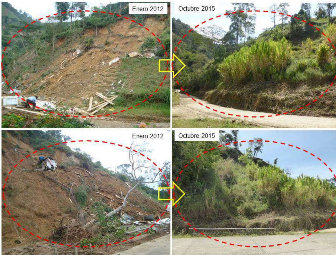
Fotografías que muestran los alrededores de la escuela de La Primavera (Vereda La Primavera), municipio de Garzón. Se observa la situación actual del lugar donde se presentó un deslizamiento.