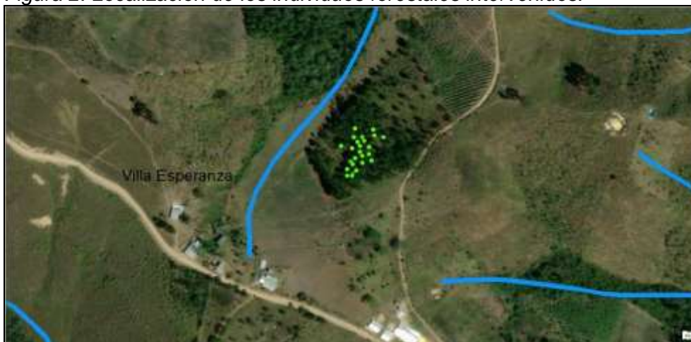
Figura 2. Localización de los individuos forestales intervenidos.

Nota. Coordenadas tomadas con el GPS GARMIN MONTANA 680.