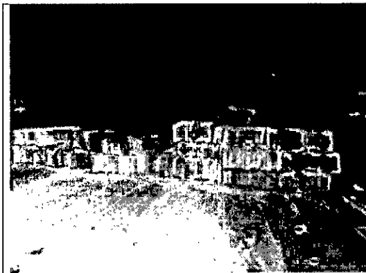
Fotografía 1. Verificación de Productos forestales objetos de decomiso preventivo.

A continuación, se presenta el registro fotográfico de los productos objeto de decomiso: