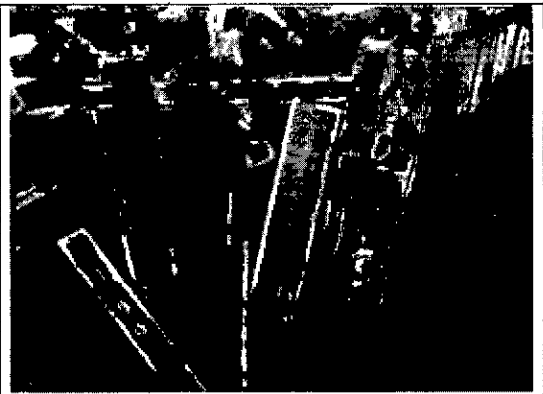
Fotografía 1. Verificación de Productos forestales objetos de decomiso preventivo.