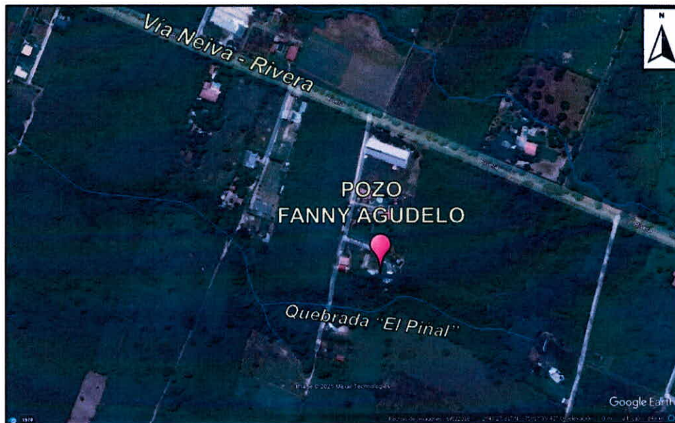
Imagen 2. Ubicación georreferenciada del pozo e hidrografía asociada al sector visitado.