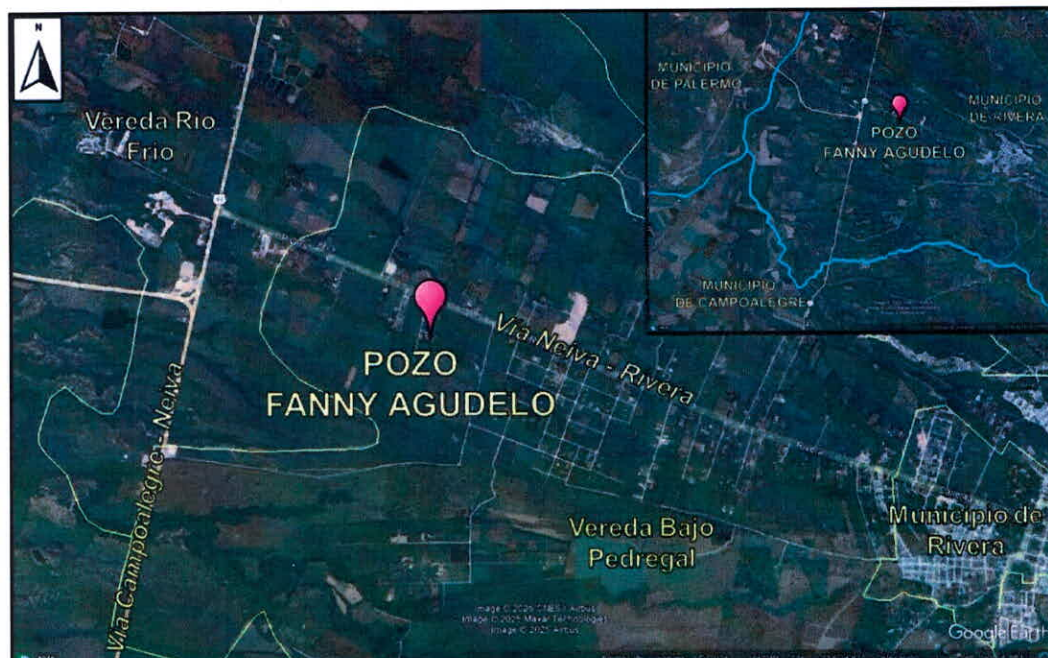
Imagen 1. Ubicación general del área de estudio y localización georreferenciada del pozo.