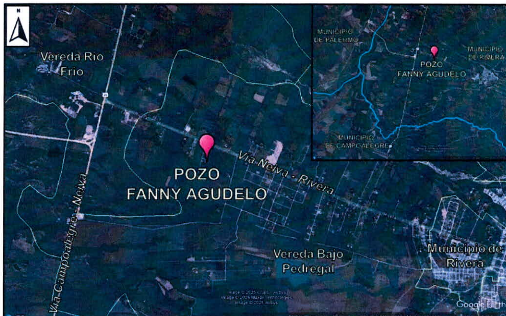
Imagen 1. Ubicación general del área de estudio y localización georreferenciada del pozo

PARÁGRAFO: Teniendo en cuenta que el volumen concesionado es de 1,72 l/s día y que la motobomba instalada al pozo expulsa o extrae 5,22 l/s, se requiere un bombeo de 5,22 l/s durante 7 horas y 54 minutos los cuales se podrán desarrollar de forma intermitente y/o continua, permitiendo que el acuífero se recupere y sin generar su abatimiento total para cumplir con el caudal solicitado.