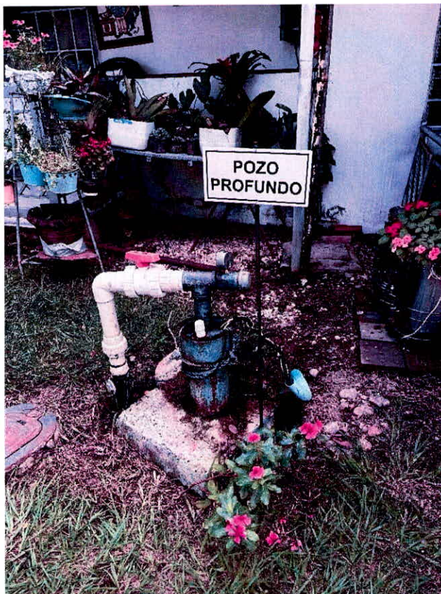
Registro fotográfico No. 2. Pozo objeto a concesionar, ubicado en el predio 8-4, vereda Bajo Pedregal del municipio de Rivera (Huila).