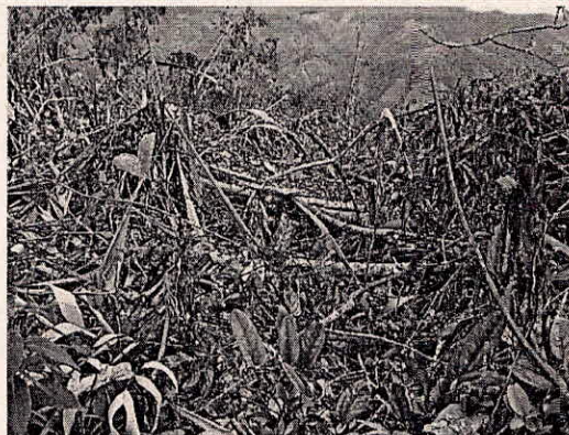
Fotografía 8 y 9. Tala del bosque protector en el predio del señor del señor Libardo Cerón.

De acuerdo con lo observado en la presente visita de inspección técnica se puede concluir que con las actividades realizadas sobre los recursos naturales se contraviene lo establecido en la normatividad en materia ambiental vigente.