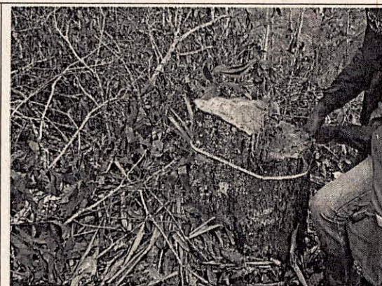
Fotografía 6 y 7. Tala del bosque protector del predio del señor del señor Libardo Cerón.