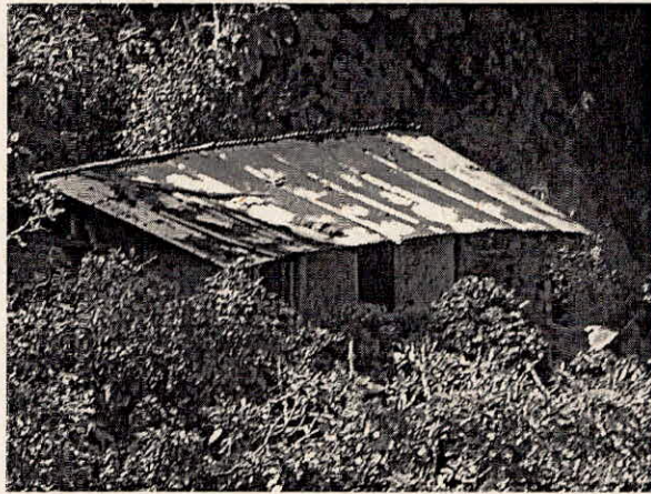
Fotografía 2. casa del señor Libardo Cerón.