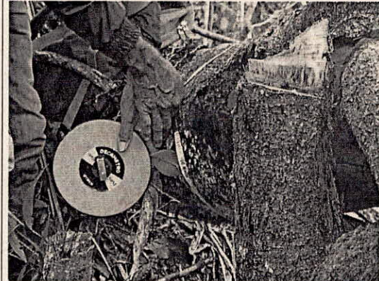
Fotografía 4 y 5 se evidencia la tala del bosque protector del predio del señor del señor Libardo Cerón. Así mismo se observa la medición del diámetro de algunos árboles.