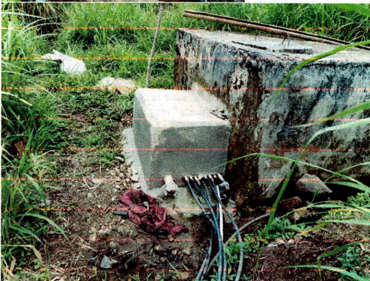
Tanque de almacenamiento