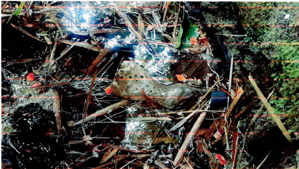
Componente para la derivación.