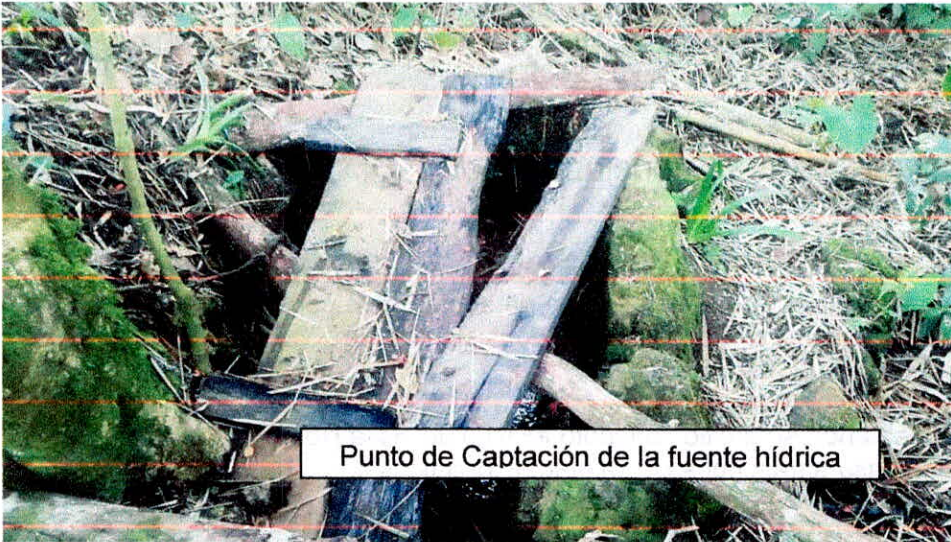
Punto de Captación de la fuente hídrica

con su compañía se llega al punto donde se realiza la captación encontrando componentes de un acueducto artesanal para la captación y derivación del agua para uso doméstico y agrícola de 7 predios, para este caso se relaciona el predio del señor Alvaro Córdoba, la captación se realiza sobre el afloramiento de la fuente hídrica sin denominación, donde emerge el agua de manera continua, en el punto de coordenadas E 749518 N 705436, a 1709msnm, esto se realiza por medio bocatoma artesanal, la cual se ubica en la intersección del afloramiento, la bocatoma está compuesta por unos muros laterales que retiene el agua de manera transitoria, donde se inserta una manguera de 1 pulgada con un tarro con orificios para retener los sólidos que colapsen el sistema de conducción. La manguera se reduce en el trayecto el sobrante retorna por el cauce.