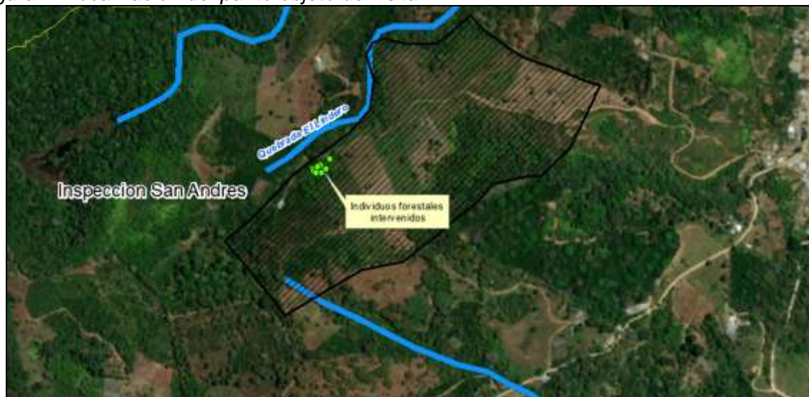
Figura 4. Localización del punto objeto de visita

Nota. Coordenadas tomadas con el GPS GARMIN MONTANA 680.