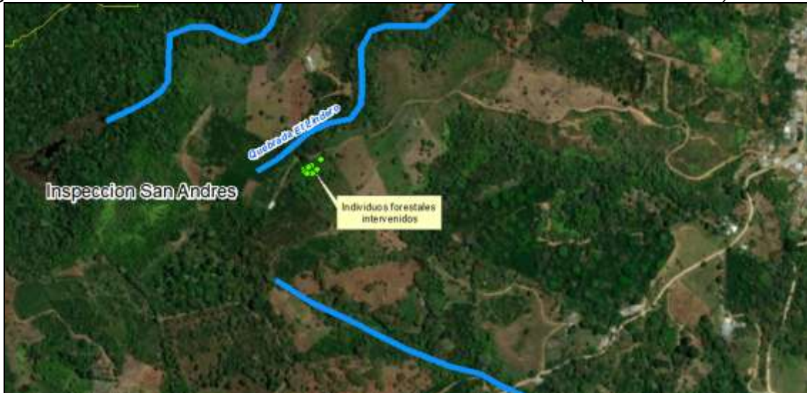
Figura 3. Localización de los individuos forestales intervenidos – (Puntos Verdes).

Nota. Coordenadas tomadas con el GPS GARMIN MONTANA 680.