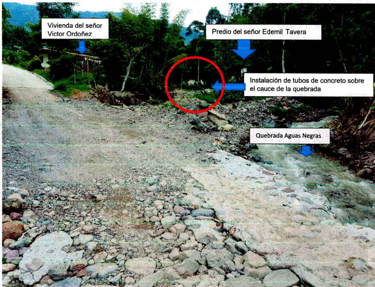
Fotografía 2. Panorámica del escenario encontrado en la visita.