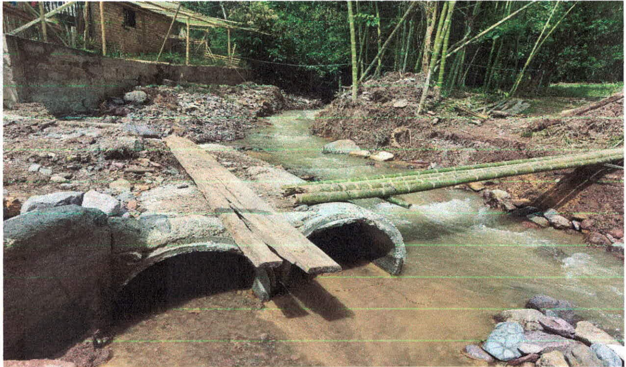
Fotografía 1. Tubos instalados sobre el cauce de la fuente hídrica quebrada Aguas Negras.

Seguidamente, se realiza inspección ocular, encontrándose, la instalación de 8 tubos de concreto ubicados sobre la fuente hídrica quebrada Aguas Negras y un muro de contención, estos tubos están ubicados paralelamente, es decir, dos líneas de cuatro tubos, tienen una longitud de 95 centímetros con un diámetro de 36 pulgadas aproximadamente. Se observó alteración del drenaje por la instalación de los tubos y del muro.