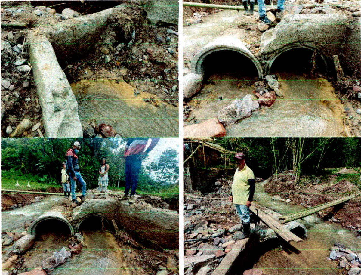
Fotografía 4 a 6. Se observa la instalación de los tubos y el muro en concreto ubicados sobre el cauce de la fuente hídrica Aguas Negras.