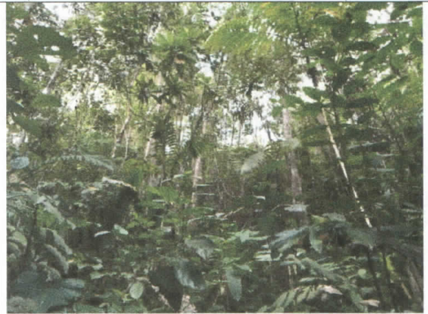
Fotografía 2. Cobertura vegetal en el área de la captación