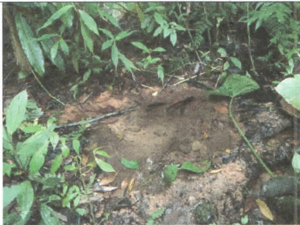
Fotografía 1. Captación

La captación de agua se realiza de forma artesanal mediante una manguera de polietileno de 3/4" dispuesta directamente sobre el cauce de la fuente hídrica sin ningún tipo de estructura, la cual recolecta el líquido y lo conduce hasta llegar al sitio del aprovechamiento del recurso, en el lote sembrado.