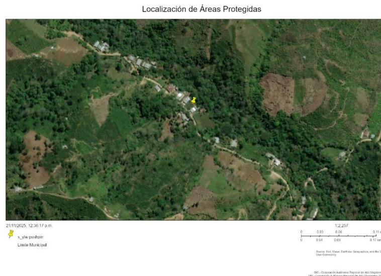
Figura 2. Se observa los puntos visitados en campo.

Por otro lado, se ingresó al sistema de información geográfica de la CAM, geoportal para identificar si el área visitada hace parte de alguna área protegida del Huila y se concluyó que el predio visitado no se encuentra dentro de ningún área protegida, según información verificada en el Geoportal de la Cam, al ingresar las coordenadas tomadas en campo.