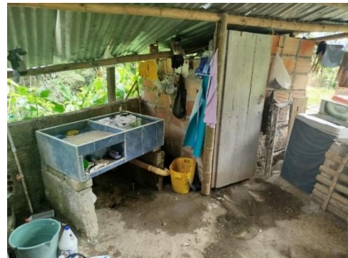
Fotografía 1 y 2. Vivienda de la señora Lisnoris Betancourt