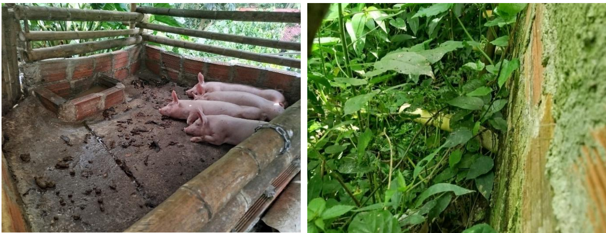
Fotografía 5 y 6. Cochera y punto de descarga vivienda señora Lisnoris

Allí, se observó que existe 1 cama o cochera donde se realiza la ceba de 4 individuos de cerdo. Esta estructura se encuentra revestida, con techo en zinc y suelo en concreto; es manejada por método húmedo de lavado, según lo mencionado, se realiza lavado de la cama de y vez al día. En cuanto al manejo de las aguas residuales no se observó sistema de tratamiento para esta actividad, estas aguas son conducidas por tubería PVC de 2" con recorrido de aproximadamente 1 metro hasta llegar al punto de descarga, detrás de la vivienda.