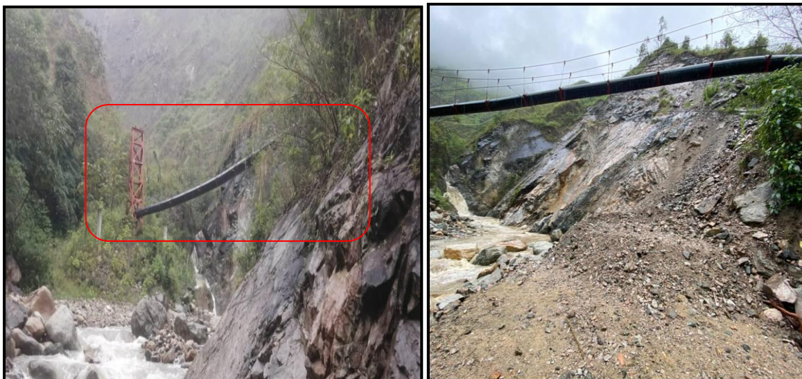
Fotografía No. 2 y 3: Torre (1) y tubería de conducción

A una distancia aproximada de doscientos cinco (205) metros lineales, aguas abajo donde se encuentra ubicado el desarenador, se observa la construcción de dos (2) torres en acero, con sus respectivos anclajes en concreto, estas se encuentran instaladas en la margen derecha e izquierda de la Quebrada denominada “La Pescada”, para la conducción principal de la tubería de 24” pulgadas de diámetro, se encuentran alrededor de las coordenadas planas de origen Magna-Sirgas Colombia/Bogotá, (tabla No.1 ítems 3).