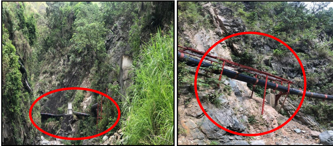
Fotografía No. 4 y 5: Tramo crítico 3

En esta misma área se encuentra el tramo crítico No. 3 este se localiza sobre la margen izquierda de la Quebrada denominada La Pescada, observándose un talud inestable, sobre el cual se apoya la tubería de la línea de conducción de las aguas del distrito de riego, por tanto, se establece que dicha estructura está en riesgo de colapso, poniendo en dificultad el abasto de agua para para satisfacer la necesidad de los usuarios del distrito de riego. Se estima que el área afectada (riesgo) es de 400 m 2 aproximadamente.