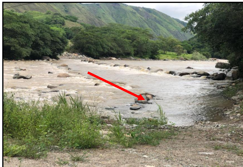
Fotografía No. 10,11: ocupación temporal cauce Rio suaza

Realizado el recorrido, se evidencia la construcción total del viaducto denominado "120", sobre el Río Suaza. Se observa cimentación de una (1) torre y anclajes a la margen izquierda del Río Suaza más exactamente en las coordenadas planas de origen Magna-Sirgas