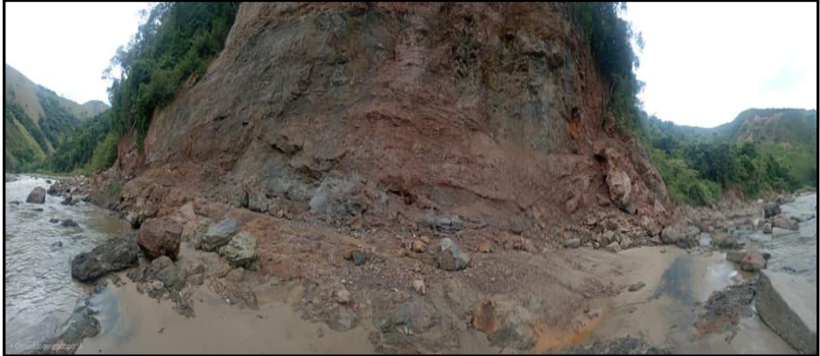
Fotografía No. 15, 16 y 17: Punto crítico No.1

Las fotografías del presente informe fueron tomadas con celular iPhone 8 prime y las coordenadas registras mediante GPS GARMIN Monterra.