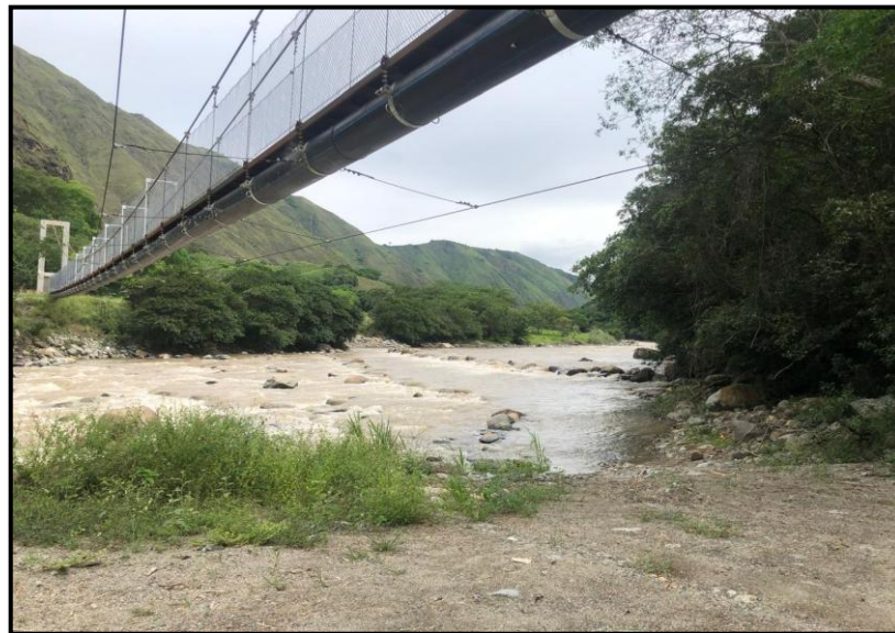
Fotografía No.12, 13 y 14: viaducto denominado "120"

En cuanto al punto crítico No. 1, el cual está ubicado en el sector de acceso a las obras del distrito de riego Llano de la Virgen, en la margen izquierda del Rio suaza, donde se observa talud inestable, el cual es desprovisto de cobertura vegetal, además se observa saturación del suelo por filtraciones de aguas desde la parte alta de la montaña, además la acción del Rio Suaza por esta margen genera una socavación, lo cual debilita la base de la ladera. Se estima que el área afectada por este proceso es de 1.500m 2 aproximadamente