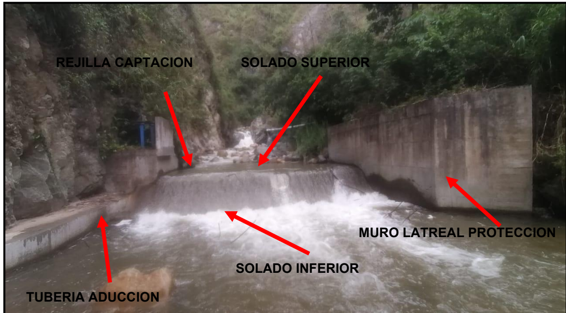
Fotografía No. 1: Captación

Se observa la construcción de tanque desarenador más exactamente en las coordenadas planas de origen Magna-Sirgas Colombia/Bogotá, (tabla No.1 ítems 2)