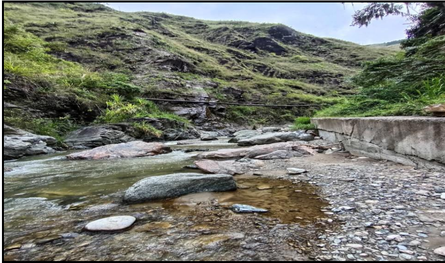
Fotografía No. 6,7 y 8: Tramo crítico 2

Posteriormente a una distancia aproximada de novecientos (900) metros lineales, aguas abajo donde se encuentra ubicado la primera torre de conducción, Se observa la construcción de dos (2) torres en acero, con sus respectivos anclajes en concreto, esta se encuentra instaladas en la margen derecha e izquierda de la Quebrada denominada “La Pescada”, para la conducción principal de la tubería de 24” pulgadas de diámetro, se encuentran alrededor de las coordenadas planas de origen Magna-Sirgas Colombia/Bogotá, (tabla No.1 ítems 4).