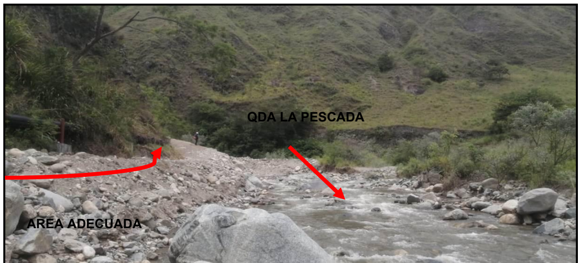
Fotografía No. 9: área intervenida

En las coordenadas planas de origen Magna-Sirgas Colombia/Bogotá, (tabla No.1 ítems 5). Sobre la margen derecha de la Quebrada Denominada “La Pescada” se realizó actividades de adecuación del área, realizando retiro de cantos rodados, y adecuación con material pétreo natural, es de mencionar que al momento de la presente visita no se observa presencia de maquinaria, herramientas o personal realizando actividades de adecuación.